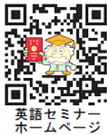
英語セミナー ホームページ

ホームページをご覧ください メールはホームページ左上の 校舎アドレスをクリックしてください。