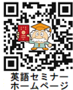
英語セミナー ホームページ