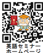
英語セミナー ホームページ

ホームページをご覧ください メールはホームページ左上の 校舎アドレスをクリックしてください。